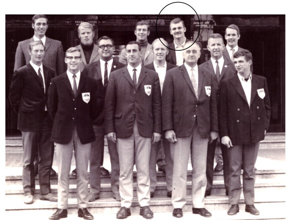
Het Bronzen poloteam van de politie uit 1970