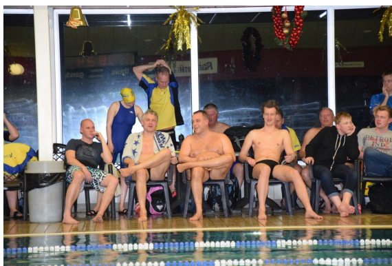
De waterpoloërs kijken tevreden naar de gezwommen resultaten

Mede door goede aanmoediging zijn er goede tijden gezwommen en kan er tevreden worden teruggekeken. Volgend jaar hoopt de waterpolo met meer zwemmers mee te doen.